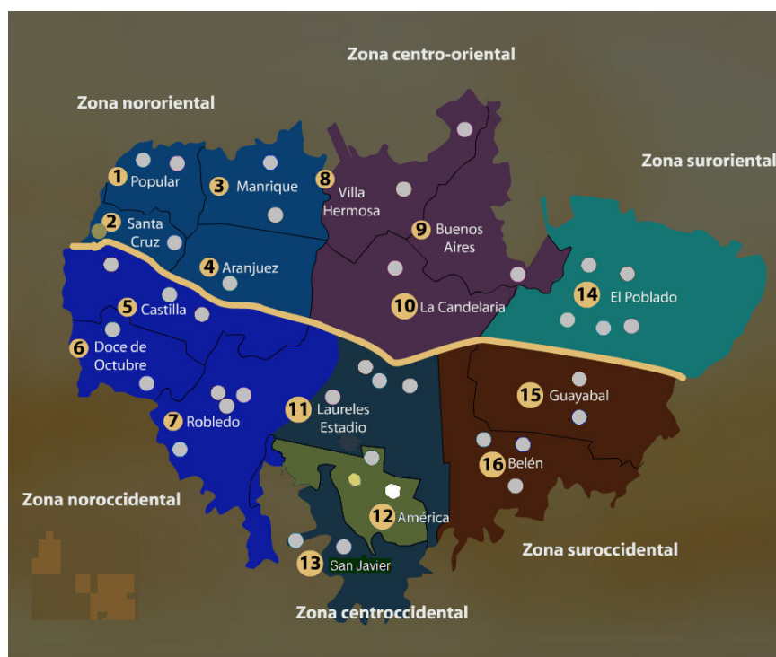
Figura 3. Representatividad poblacional en el Preseaa-Medellín.

Finalmente, para visualizar la representatividad poblacional del Preseaa-Medellín, podemos trasladar la información de la tabla 4 al mapa (Figura 3). Cada punto en el mapa representa un eje barrial con una cuota de 4 informantes. En cada casilla se disponen 3 ejes barriales en donde ubicar a 12 informantes (sumando hombres y mujeres) de los 144 del total. Se aprecia así en el mapa también una buena cobertura geográfica de la ciudad que se espera corresponda a una representatividad cualitativa a través de los parámetros designados en este trabajo. La postestratificación por clase social y la generación de una base de datos sonoros sociolingüísticos sistematizada darán cuenta de ello.