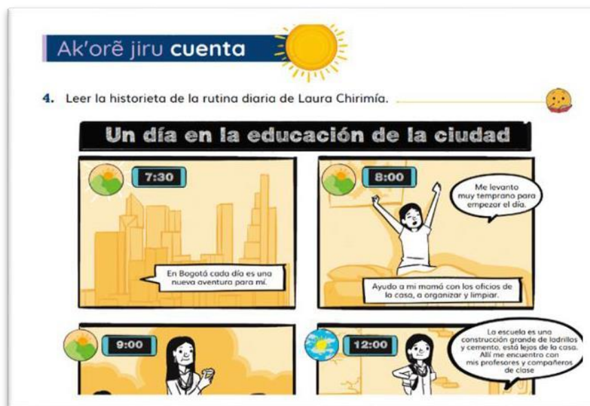
Figura 2. Uso del español como L2. Atane nos enseña... (Rubio et al., 2024, p. 96)

Indudablemente, este aprendizaje del español estará enmarcado por los elementos culturales y la cosmovisión que la comunidad tiene sobre los procesos de aprendizaje. Aquí, la sabiduría ancestral juega un papel determinante en la estructura y organización de las actividades para alcanzar el objetivo comunicativo en español. Este proceso debe estar alineado con la manera en que la comunidad indígena considera el mejor camino de aprendizaje. Pérez (2018) afirma que es un rasgo ancestral y comunitario que la mayoría de los pueblos indígenas basen sus procesos de aprendizajes y enseñanza en proyectos integradores a través del Proyecto Educativo Comunitario (PEC). De esta manera, una de las estrategias didácticas que puede orientar el aprendizaje del español puede ser a través de un proyecto integrador vinculado con un elemento cultural de la comunidad.