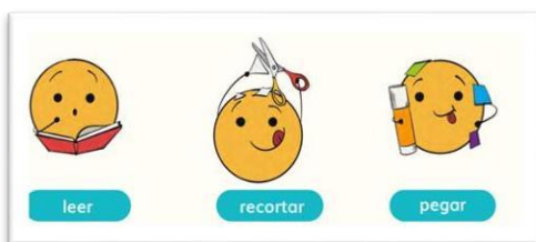
Figura 8. Uso de íconos. Atane nos enseña... (Rubio et al., 2024, p. 13)

Otro aspecto de forma que enriquecerá el material es la creación de recursos audiovisuales, estos ayudarán a los docentes a fortalecer las actividades de comprensión y motivará a los estudiantes a completar sus tareas comunicativas. Se recomienda que los recursos en lengua indígena se realicen con miembros de la comunidad para que el registro sea el modelo más cercano a la realidad de los estudiantes y que, además, el docente investigador oriente este proceso para que haya claridad sobre cuál es el fin comunicativo de crear los recursos audiovisuales.