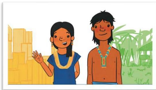
Figura 6. Presentación de los personajes. Atane nos enseña (Rubio et al., 2024, p. 7)

Para finalizar con los elementos de fondo, se debe tener en cuenta que al ser necesario el acercamiento en lengua indígena en el aprendizaje del español como L2, el material didáctico puede contar con las traducciones de lengua indígena al español como un complemento para el docente de español L2. Sin embargo, se hace énfasis en la importancia de que los aprendientes se acerquen al reconocimiento de la lengua indígena escrita y que desarrollen estas actividades en compañía de un modelo de la lengua indígena. Además, las traducciones permitirán a los interesados en el material comprender los elementos lingüísticos y culturales de la lengua indígena. Con relación a los elementos de forma, se sugiere definir si el material didáctico será digital, físico o digital imprimible, pues este aspecto definirá la forma en que se diseñarán las actividades y el formato de presentación de los recursos escritos, auditivos o audiovisuales. Por ejemplo, para las actividades de formato digital, PDF, que involucren relacionar dos elementos en dos columnas a través de líneas no se podrá realizar, sería necesario cambiar la instrucción para relacionar las columnas con letras y números.