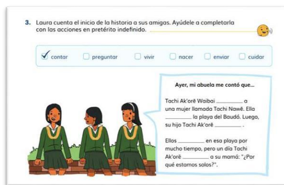
Figura 5. Actividad Interculturalidad. Atane nos enseña... (Rubio et al., 2024, p. 119)