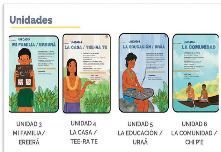
Figura 3. Orden de los contenidos en las unidades. Atane nos enseña... (Rubio et al., 2024)