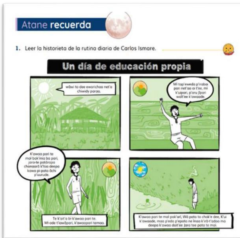
Figura 1. Uso de la lengua indígena. Atane nos enseña... (Rubio et al., 2024, p. 92)

Hamel et al. (2004) debe existir una interdependencia entre L1 y L2 para no generar un bilingüismo sustractivo y es que, si definitivamente el objetivo es que los estudiantes indígenas logren un nivel de proficiencia en las destrezas comunicativas del español, primero es necesario fijar la atención en el fortalecimiento de las mismas destrezas en lengua materna. Es decir, como se muestra en la Figura 1, las actividades que se diseñarán en el material didáctico deben realizarse primero en lengua indígena, esto con el fin de que el estudiante fortalezca su identidad cultural y sus competencias comunicativas en L1 y, luego, comprenda cuál es el objetivo comunicativo que debe alcanzar en español.