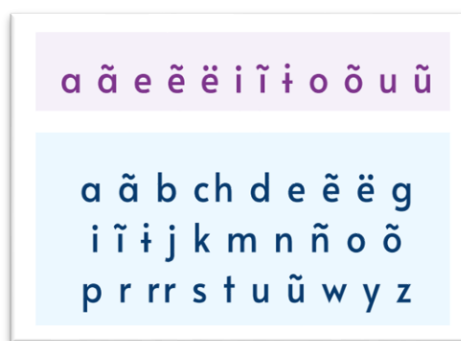
Figura 7. Tipografía en el abecedario de lengua Siapedee. Atane nos enseña... (Rubio et al., 2024, p. 16)

Se recomienda el uso de íconos para reforzar las instrucciones y facilitar la comprensión de las actividades. El diseño de estos íconos deberá ser llamativo visualmente y acorde a las características (edad, cultura, intereses) de los aprendientes. Ejemplo de lo anterior, se refleja en la Figura 8 del libro donde se diseñaron 10 íconos para acompañar las instrucciones de las actividades. Y con el pilotaje de las unidades se identificó que los íconos les permitían a los estudiantes una mayor comprensión de las instrucciones y a su vez, anticipar la tarea de la siguiente actividad.