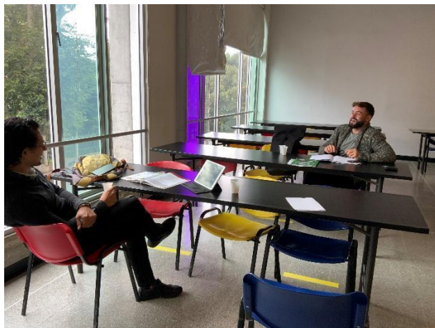
Figura 1. Trabajo de intervención en el aula Grupo 1(ABP)

Luego de unas semanas se llega a la construcción de un libreto y se produce el pódcast. Este momento es clave por cuanto se revisa el libreto, se lee, se corrige y se deja quieto por dos o tres días, luego se retoma y se vuelve a hacer revisión y corrección, pero más de parte del estudiante que del profesor. De la misma manera, la producción implica un ejercicio de paciencia para leer, grabar, escuchar, valorar, repetir, editar cuantas veces sea necesario hasta que los protagonistas del pódcast estén satisfechos, como se ve en la Figura 2. Finalmente, se edita con sonidos y efectos especiales para obtener un mejor producto. Es preciso aclarar aquí que es conveniente evaluar tanto el proceso de implementación del pódcast como el producto en sí mismo.