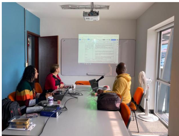
Figura 2. Producción y edición del pódcast. Grupo 2.

Antes de presentar los resultados de esta investigación, es necesario ilustrar algunos referentes teóricos en los que se sustenta la expresión oral.